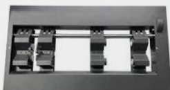
Fijador de cilindro (opcional)

El fijador de cilindro eléctrico permite una impresión rotativa de 360°. Con el fijador de cilindro instalado en la cama plana, la ArtJet 6090 DTF puede imprimir medios de hasta 180 milímetros de altura.